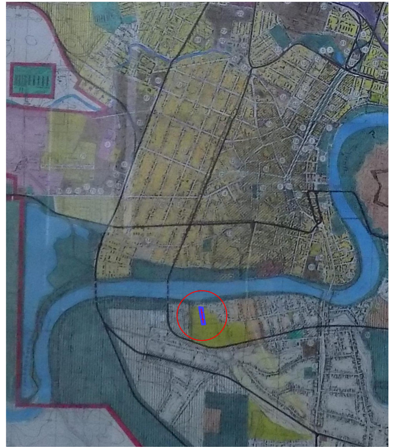
Incadrare in PUG sc. 1:25 000