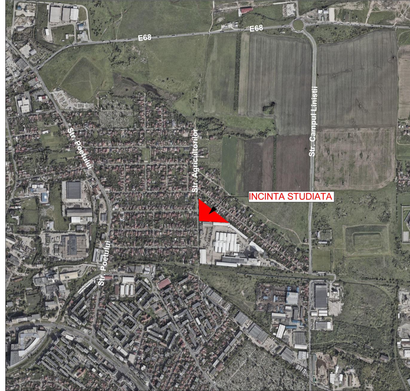
PLAN DE ÎNCADRARE ÎN ZONĂ