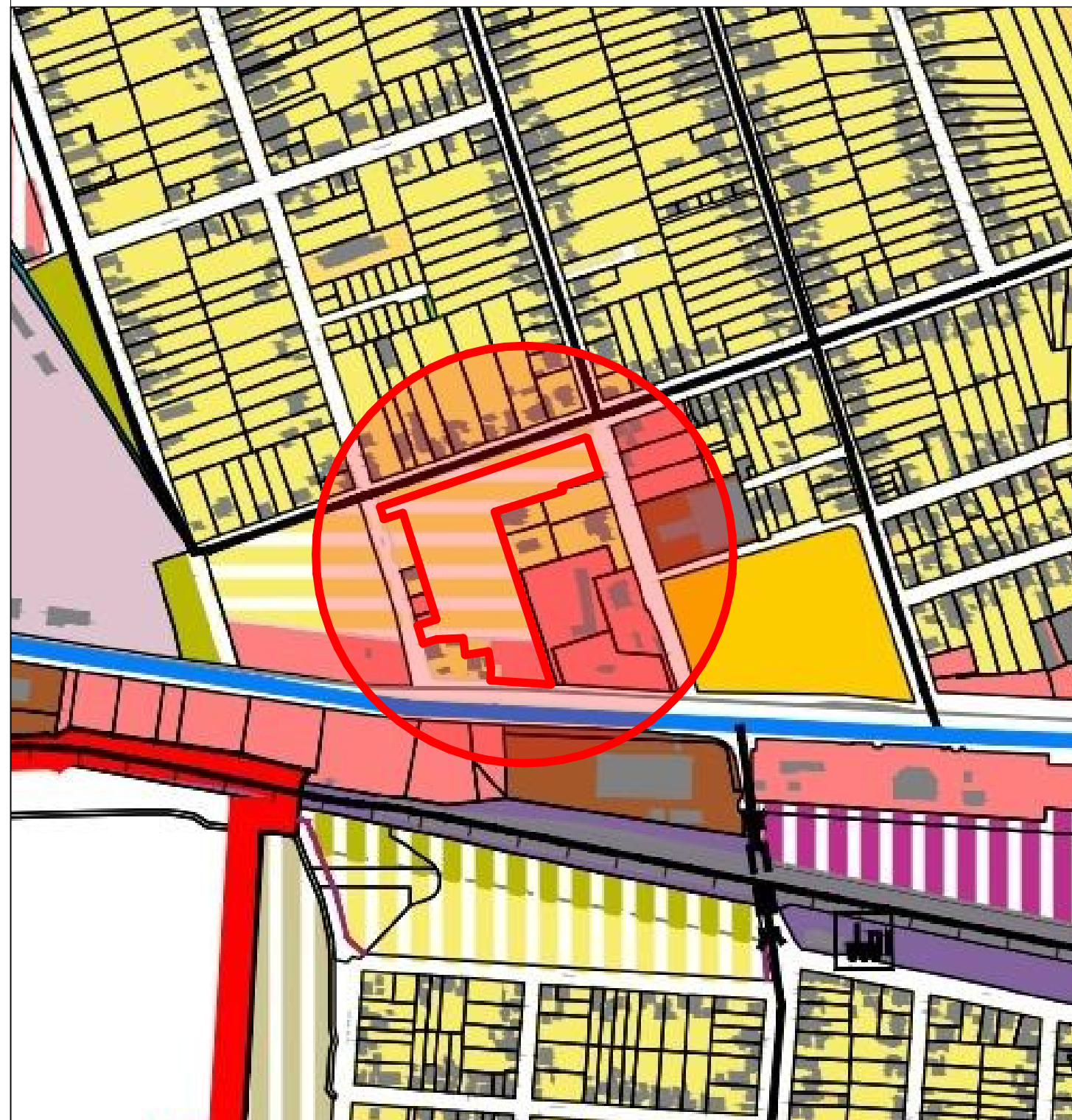
INCADRARE P.U.G. - REGL. URBANISTICE PROPUSE - 1:5000