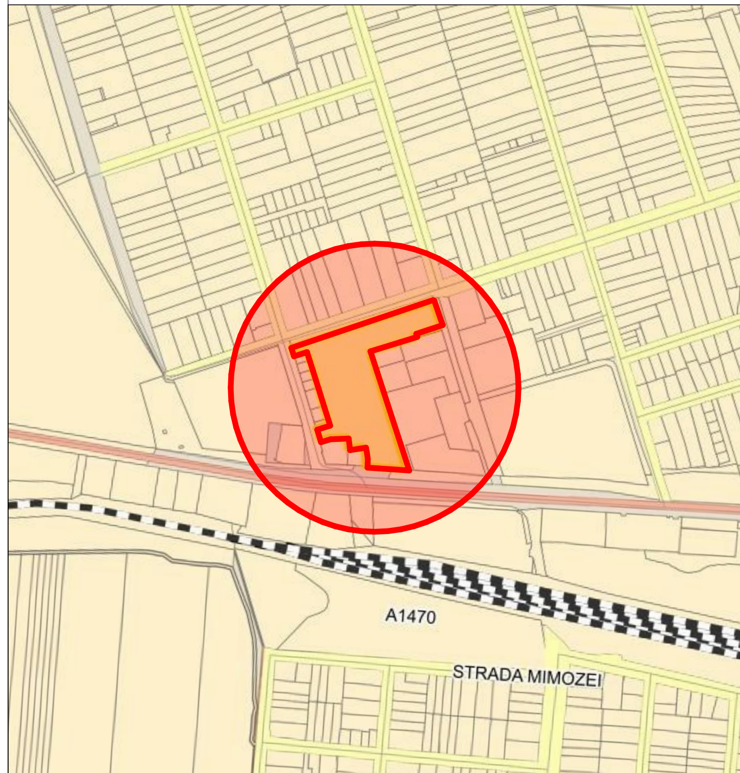
INCADRARE P.U.G. - SITUATIA EXISTENTA - 1:5000