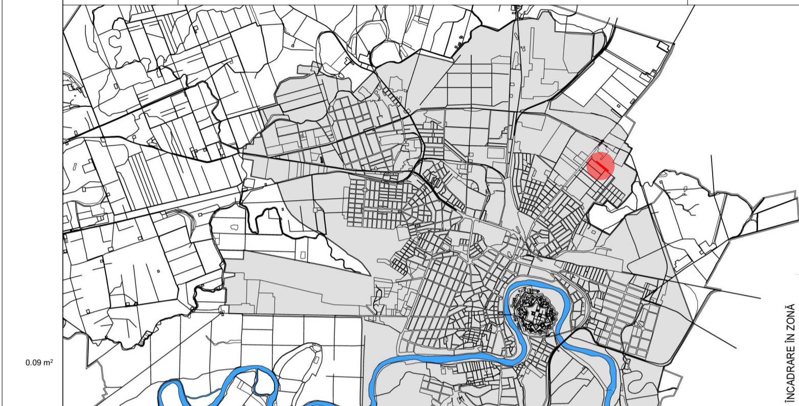
0.09 mp INCADRARE IN ZONA