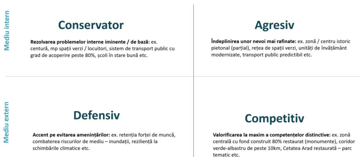
FIGURA 1 MATRICEA „SPACE” CARE STĂ LA BAZA STRATEGIEI

Cele patru opțiuni strategice pot fi exemplificate în cazul municipiului Arad, după cum urmează: