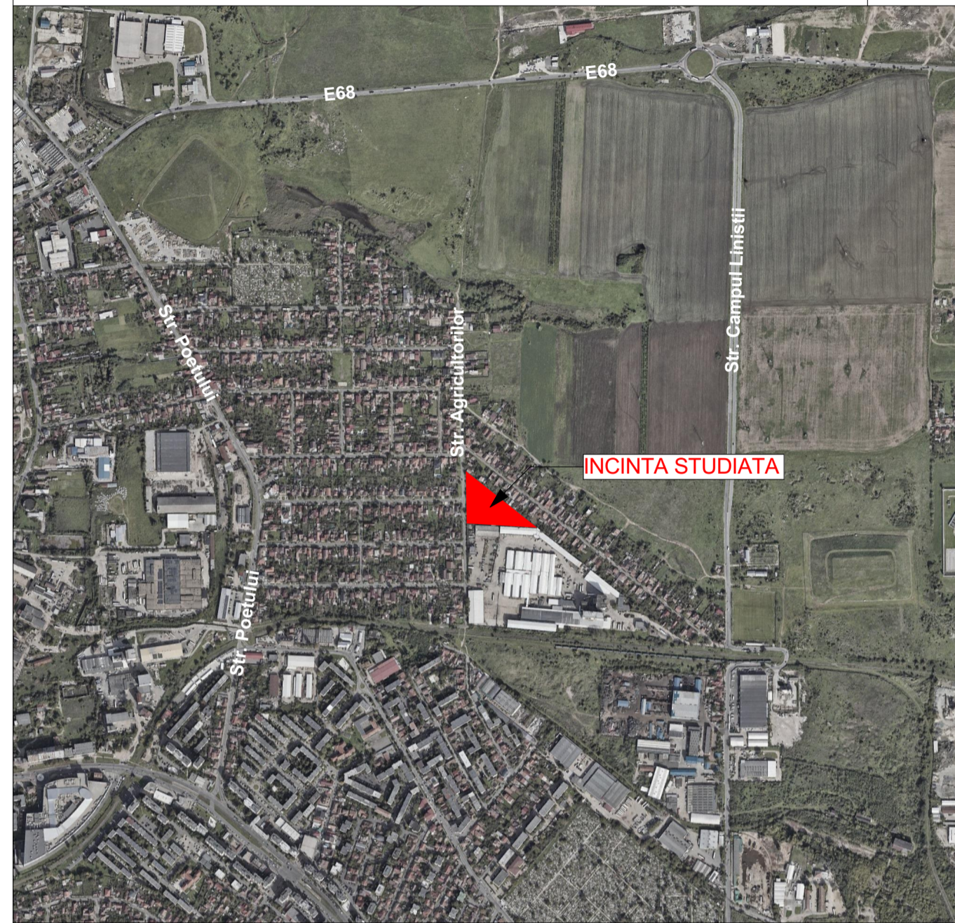
PLAN DE ÎNCADRARE ÎN ZONĂ