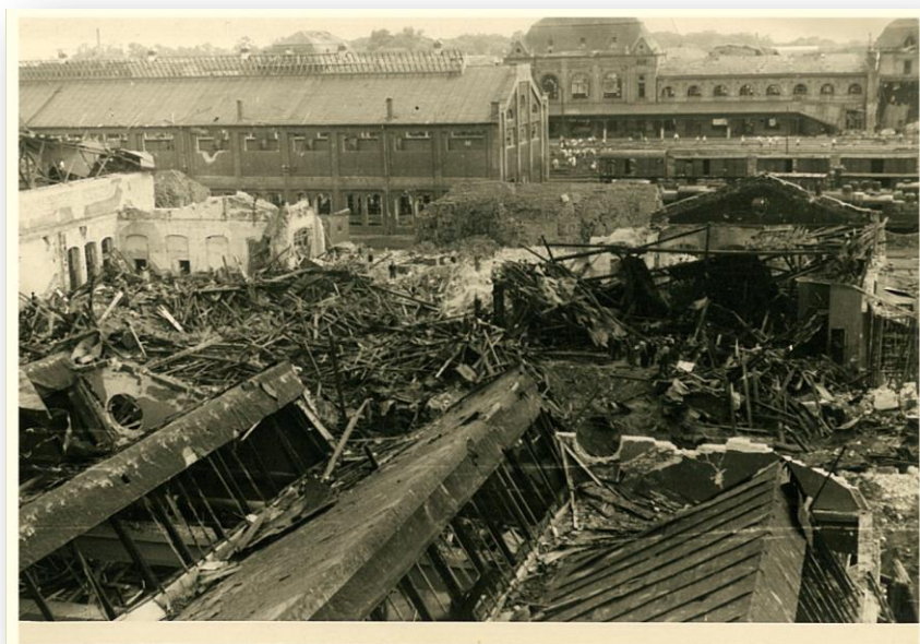
Figură 1 Atelierele C.F.R. Arad. Secția Vagonaj. 3 iulie 1944