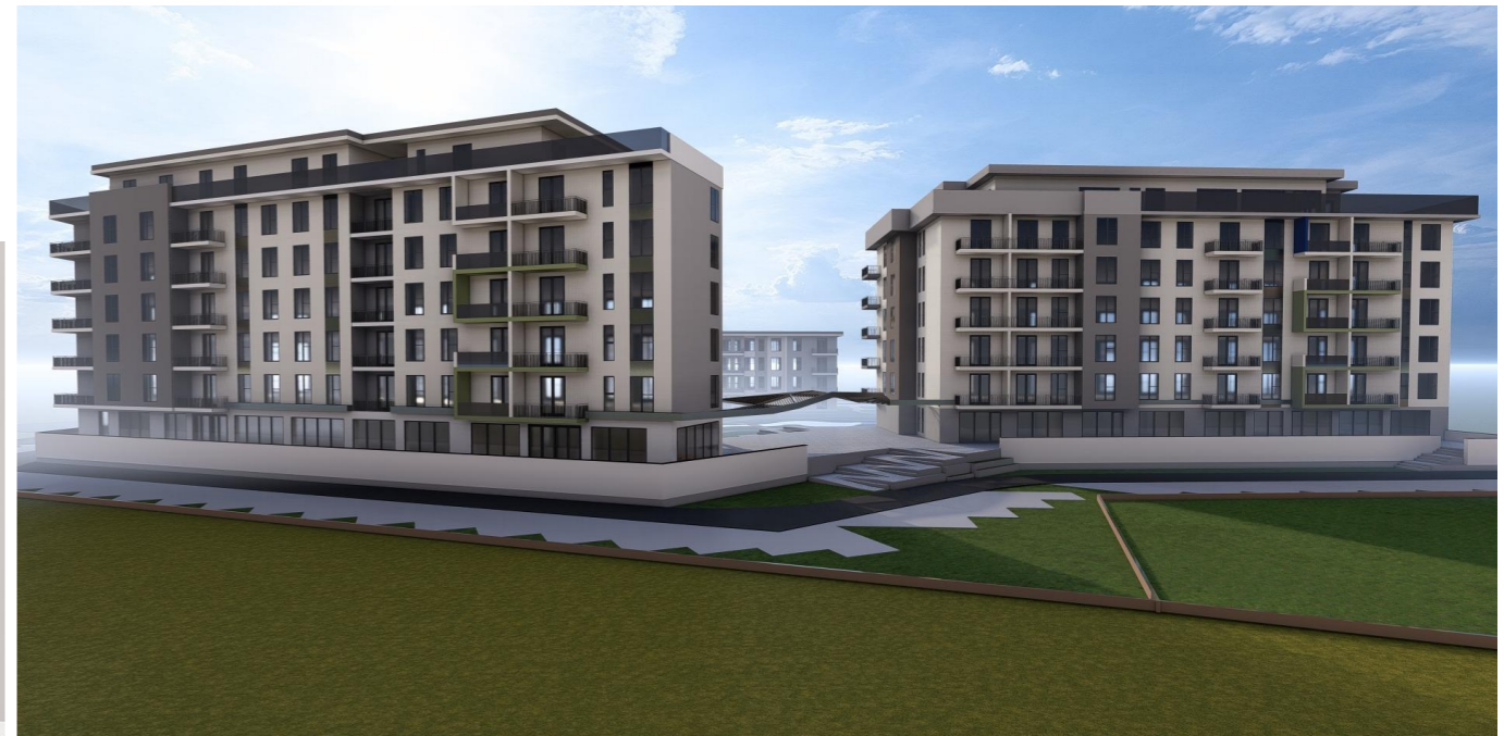
CALEA AUREL VLAICU