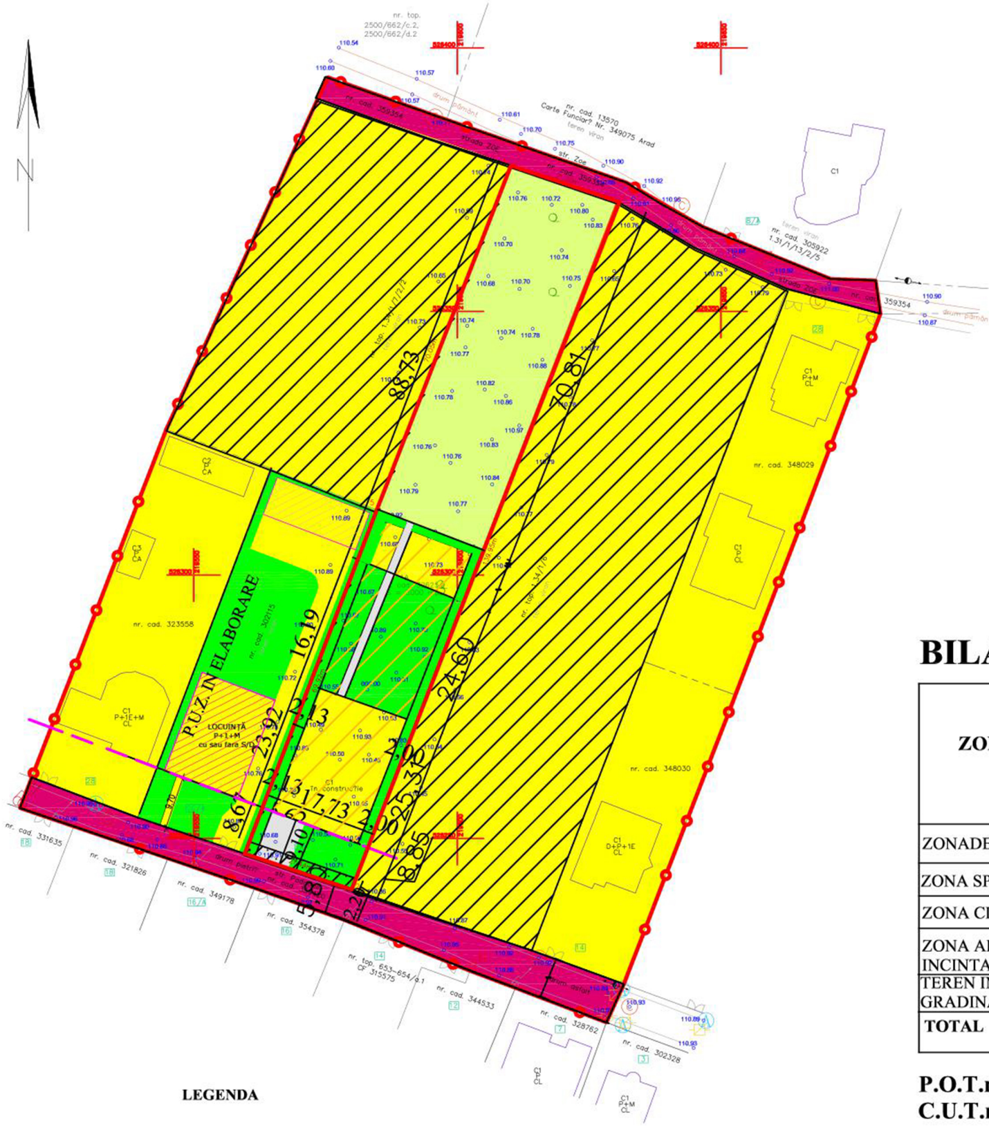
INCADRARE IN ZON? scara 1:5000