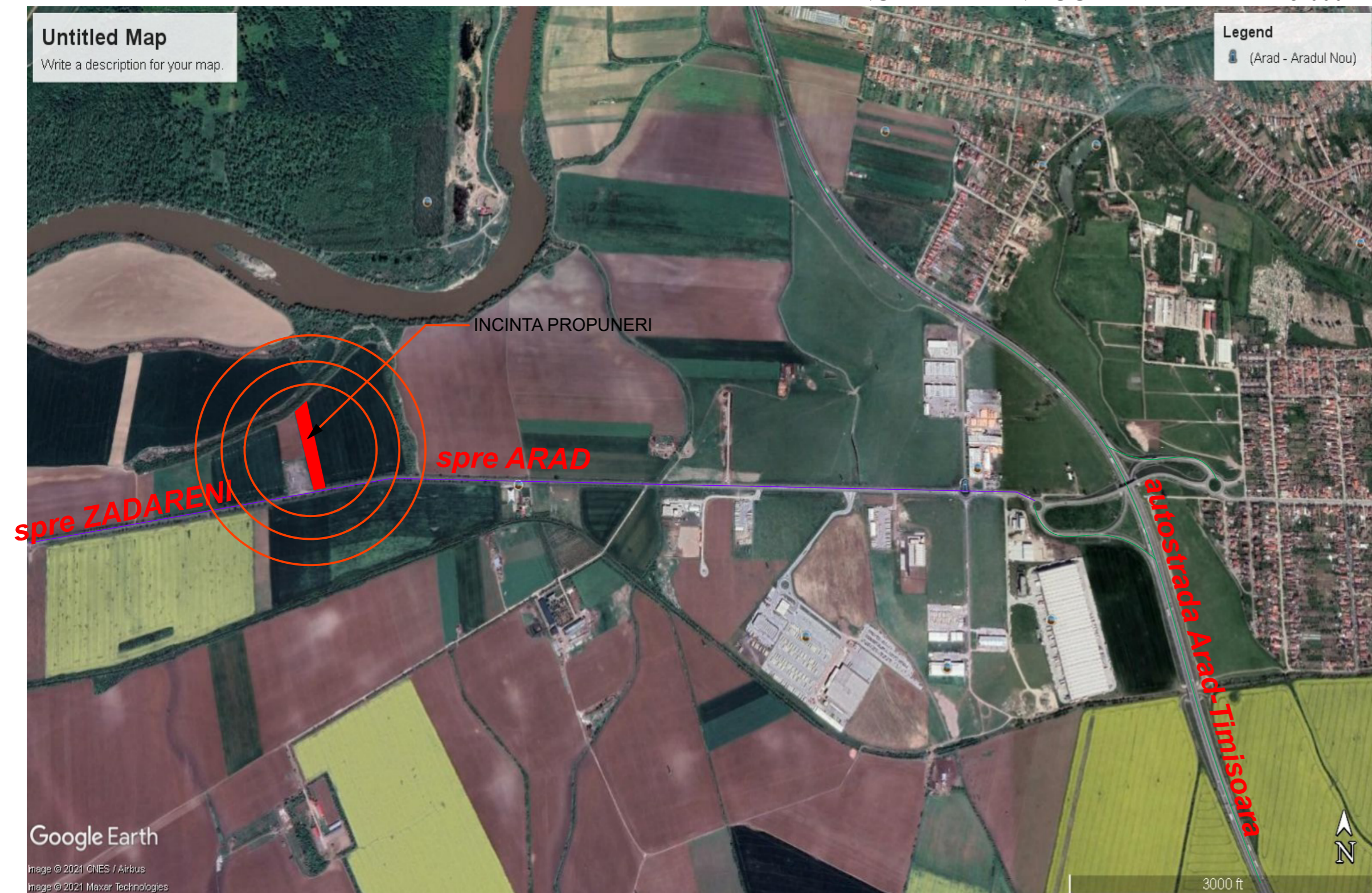
INCADRARE IN LOCALITATE - scara 1:5.000